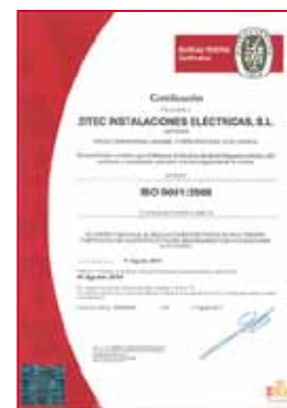
ISO 9001 / 2008

Intégré de Gestion de la Qualité et de l'Environnement basé sur les exigences fixées par les normes UNE-EN-ISO 9001 : 2008 et UNE-EN-ISO 14001 : 2004 , et axé autour de cette politique Qualité Environnement.