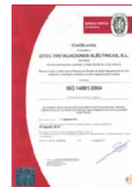
ISO 14001 / 2004